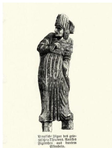
Figura 01 – Representação dos trajés dos atores das tragédias e comédias gregas com suas túnicas e coturnos

Mais à frente no tempo, na Grécia Antiga, podemos trazer apresentar hipóteses de que o figurino passa a ser empregado como um dos elementos dos espetáculos, indo desde a utilização de peles de bode durante o cortejo do Ditirambo, até as indumentárias utilizadas nas tragédias e comédias. Nesse sentido, alguns autores defendem que, naquele período, trajavam-se túnicas e um manto para cobrir as plataformas altas dos coturnos que tinha como finalidade, ampliar os corpos dos atores perante o espaço cênico (NERY, 2003, p. 39 apud SCHOLL; DEL-VECHIO e WENDT, 2009, p. 05).