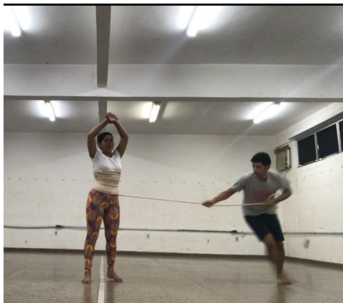
Figura 06 – Experimentação com objeto corda