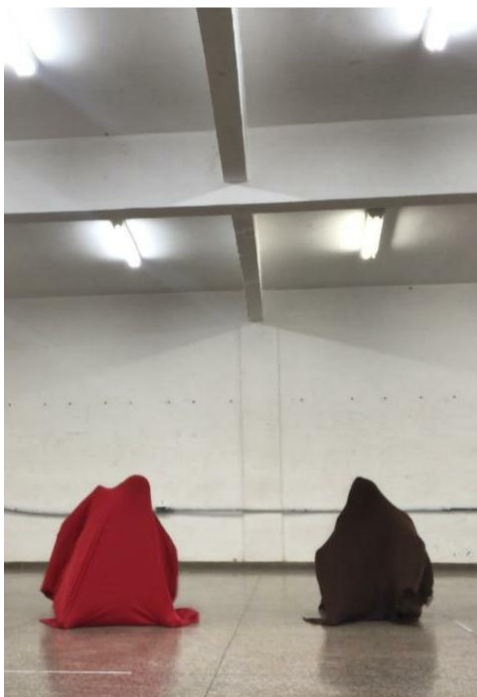
Figura 08 – Experimentação com objeto tecido