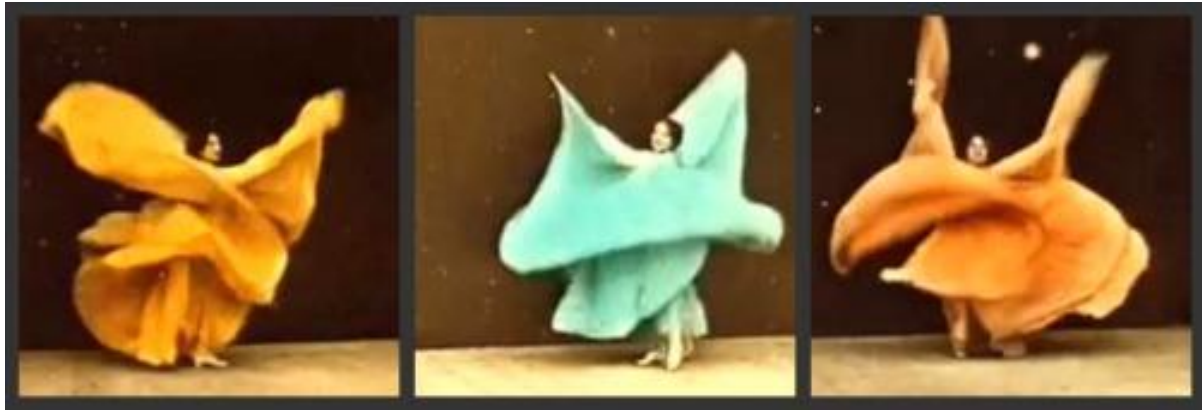
Figura 02 - Danse Serpentine de Loie Fuller