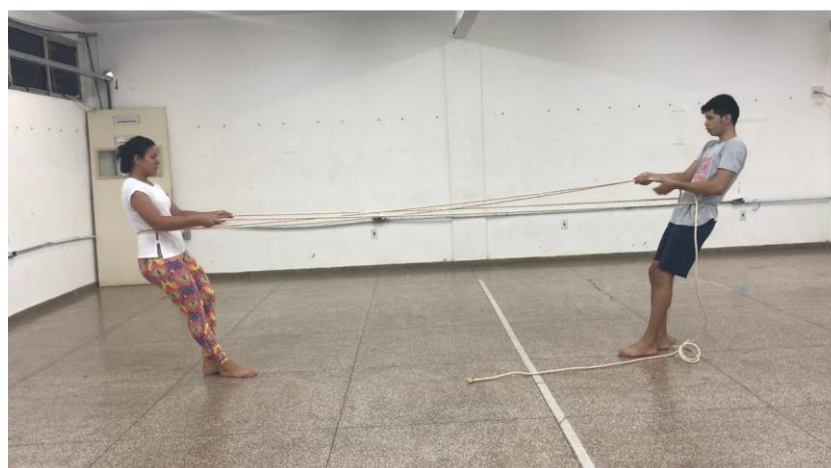
Figura 07 – Experimentação com objeto corda