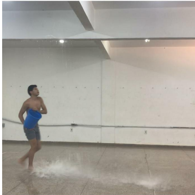
Figura 09 – Experimentação com objeto água

Para finalizar, jogamos o resto de água presente no balde para cima, onde atingiu o teto e produziu uma espécie de chuva, onde nasceu uma imagem potente e com uma sonoridade muito agradável, permitindo finalizar a performance assim que a última gota de água caísse ao chão.