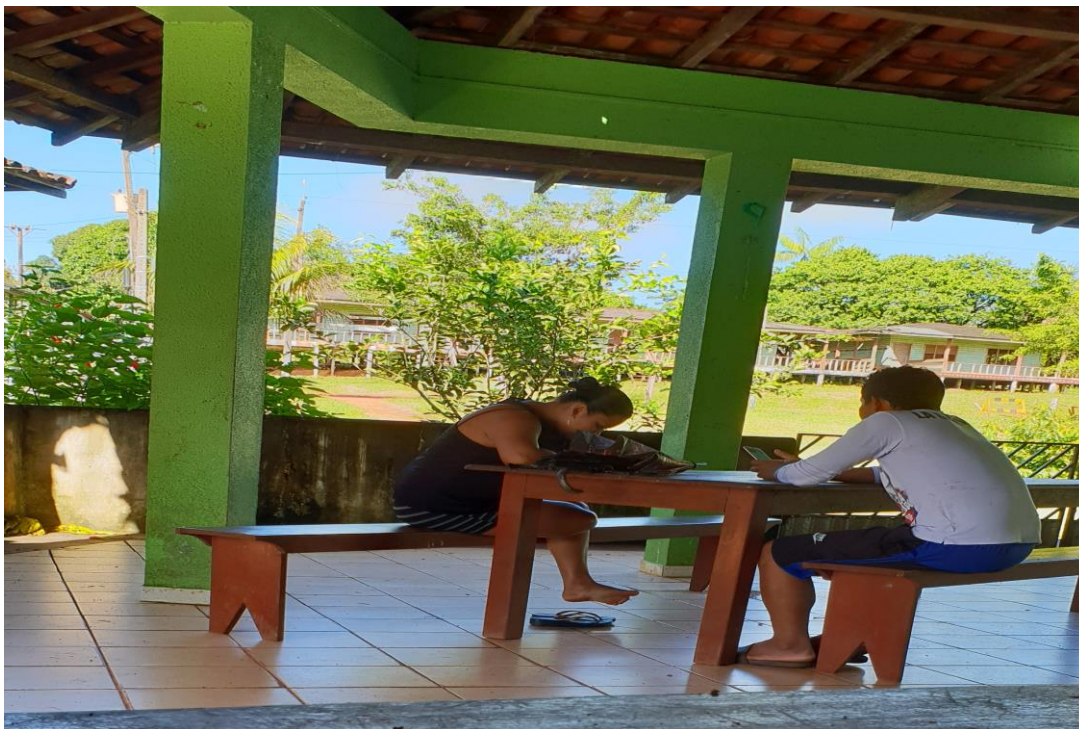
Figuras 5 e 6: Jovens acessando internet na aldeia Manga

adultos de responsabilidade é permitido a entrada na escola para desenvolver o acesso, desde que estes também respeitem o ambiente. Isso é perceptível nas figuras abaixo (5 e 6).